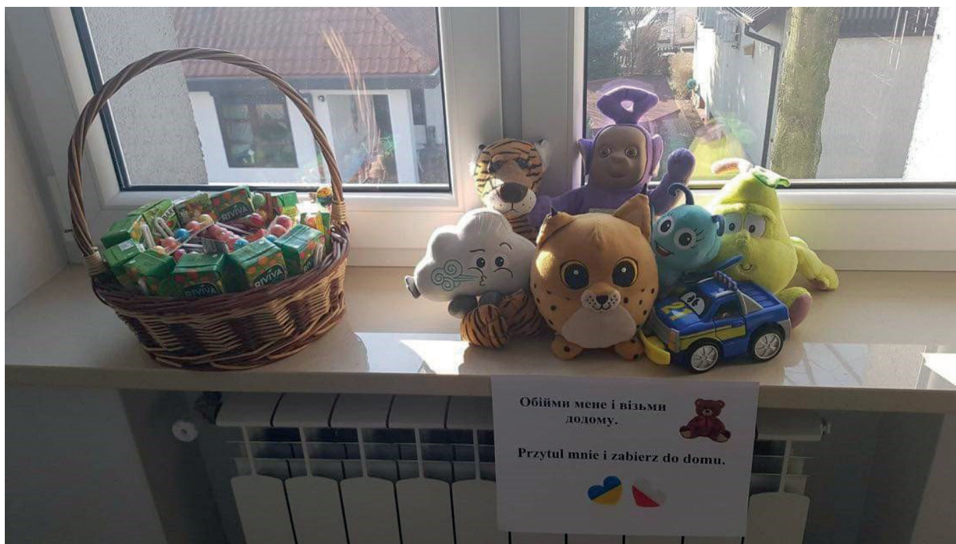
Stoisko przed biurem rejestracji dla obywateli Ukrainy w siedzibie UG Chodzież