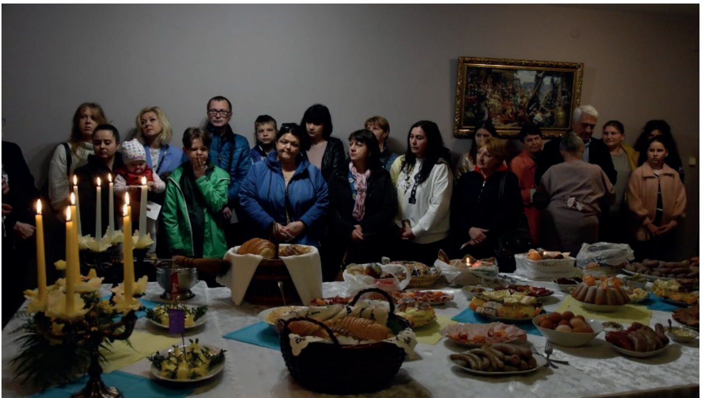
Wielkanoc prawosławna/ święcenie potraw w kościele p.w. NNMP w Chodzieży współorganizowana przez Gminny Ośrodek Pomocy Społecznej w Chodzieży, Gminę Chodzież i Caritas