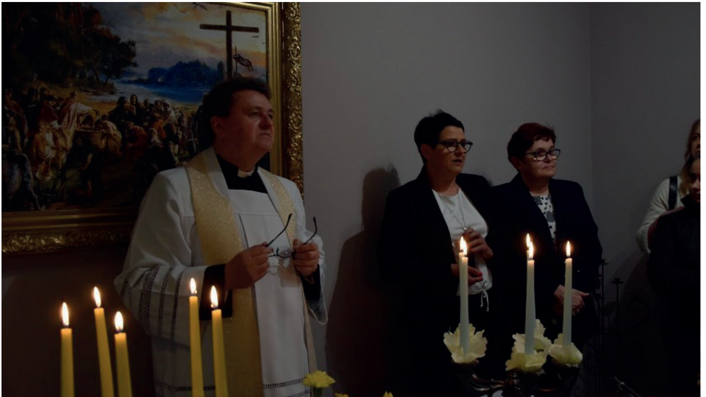
Wielkanoc prawosławna/ święcenie potraw zorganizowana dla obywateli Ukrainy w kościele p.w. NNMP w Chodzieży