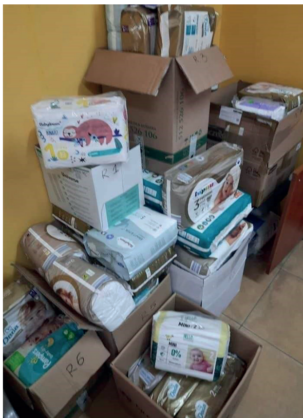
Magazyn z darami dla obywateli Ukrainy zorganizowany w siedzibie UG Chodzież