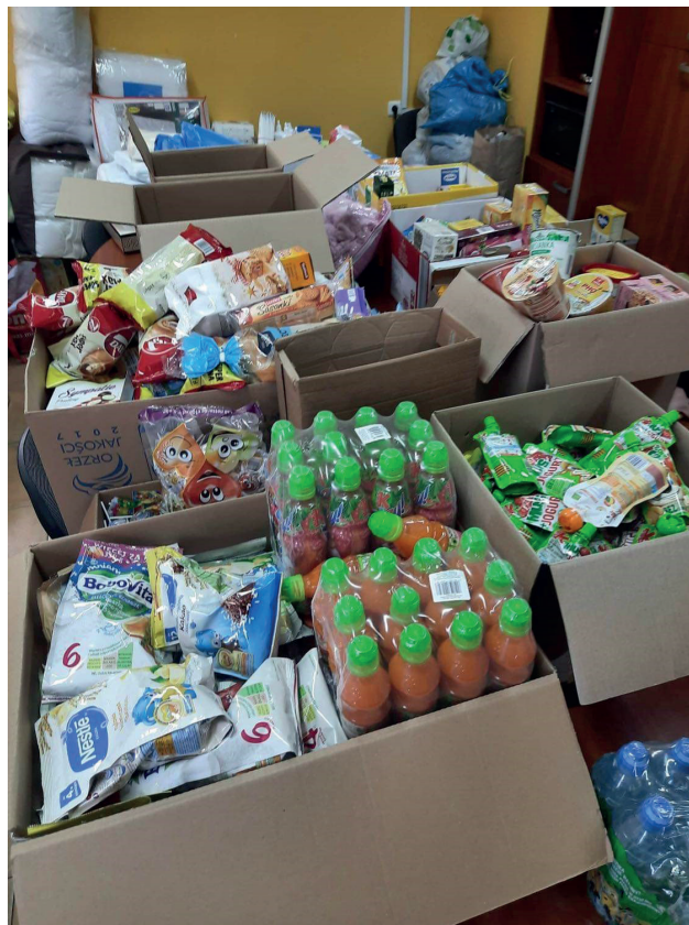
Zbiórka darów dla obywateli Ukrainy zorganizowana przez Stowarzyszenie SOCIUS we współpracy z Gminą Chodzież i Gminnym Ośrodkiem Pomocy Społecznej w Chodzieży