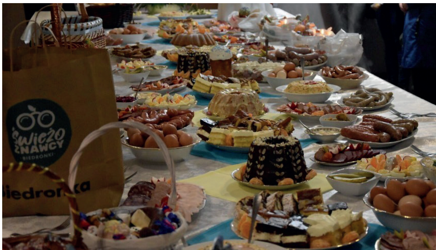
Wielkanoc prawosławna/ święcenie potraw współorganizowane dla obywateli Ukrainy przez Gminny Ośrodek Pomocy Społecznej w Chodzieży i Caritas w kościele p.w. NNMP w Chodzieży