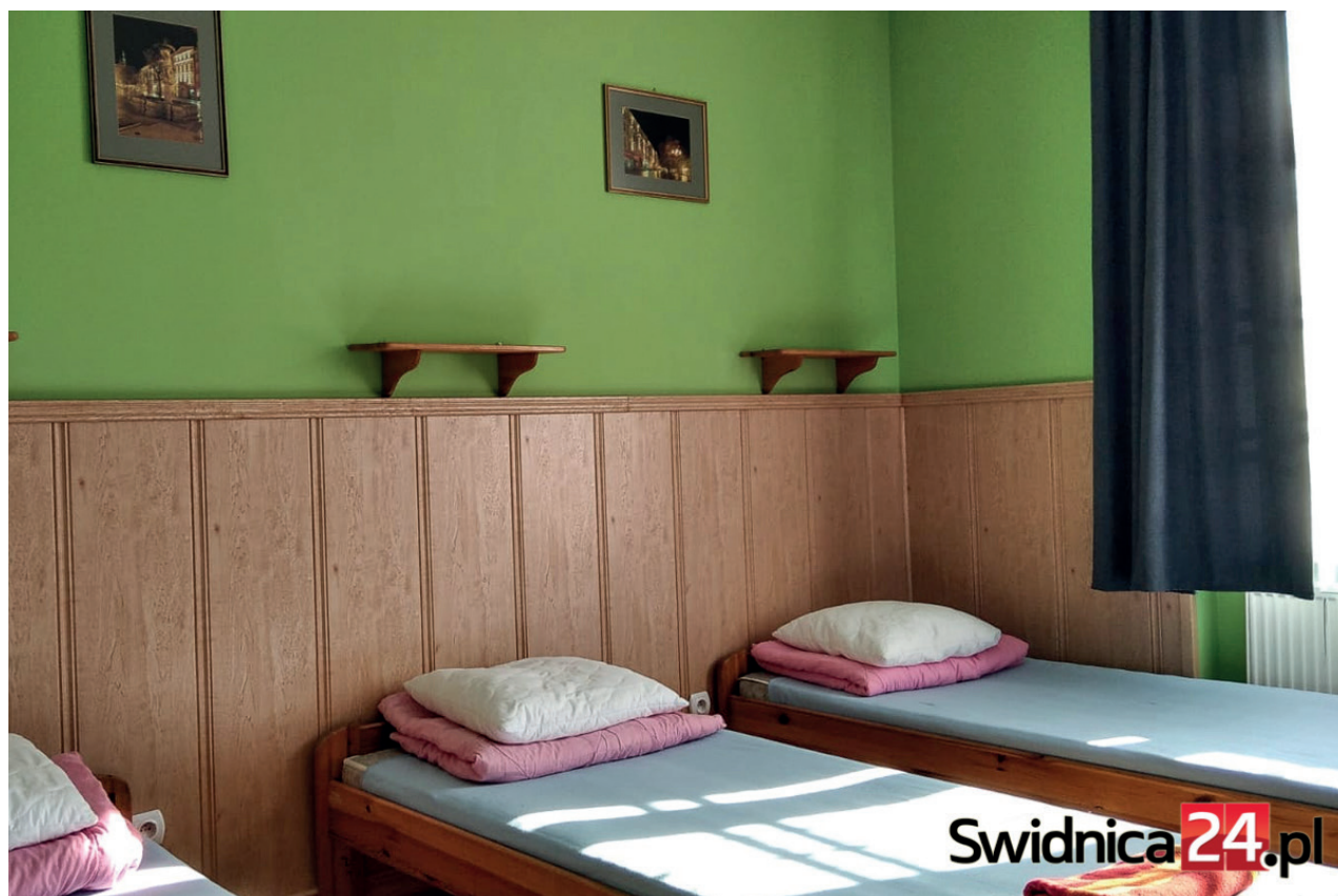
Miejsce pobytowe dla uchodźców