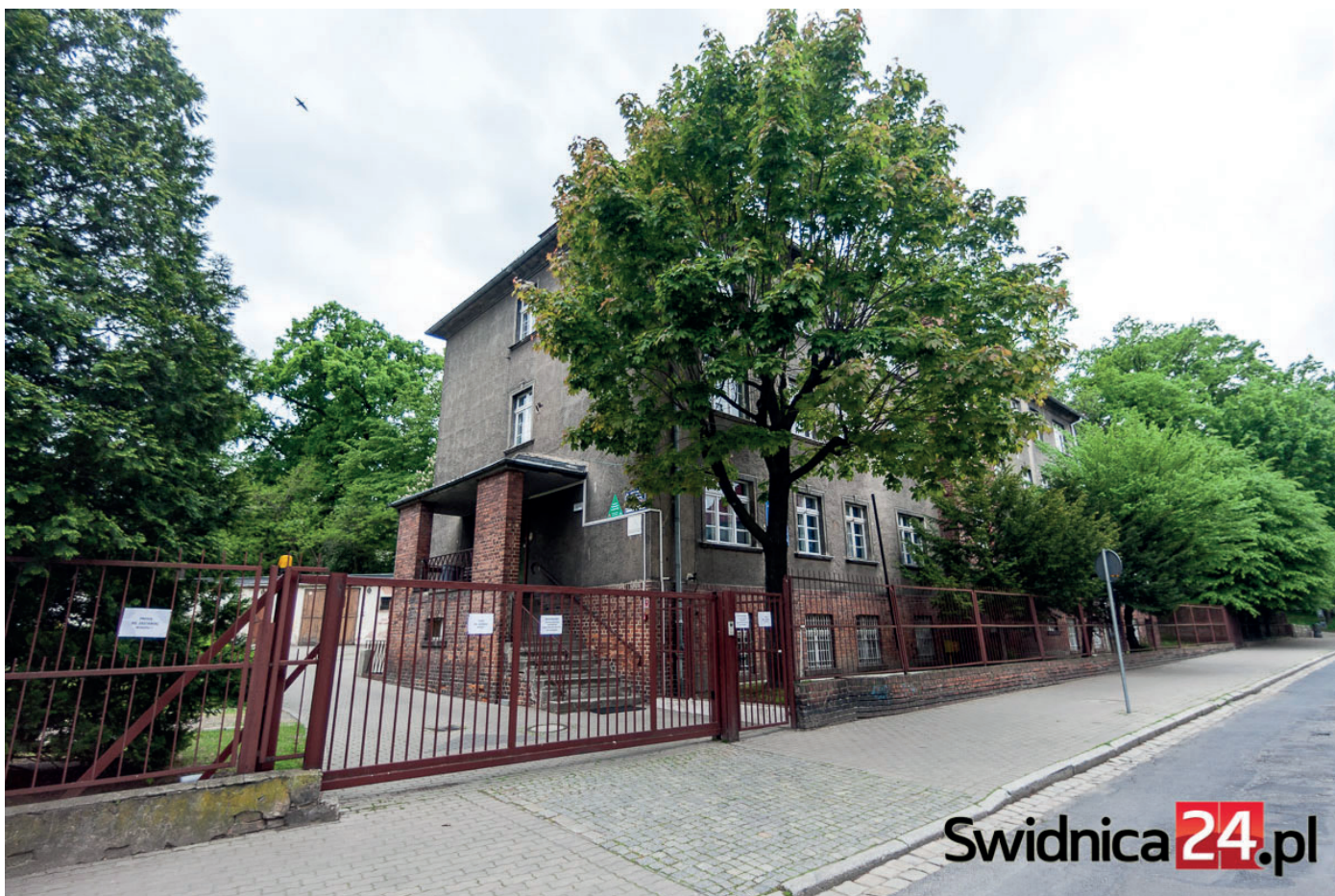
Schronisko Wycieczkowe w Świdnicy