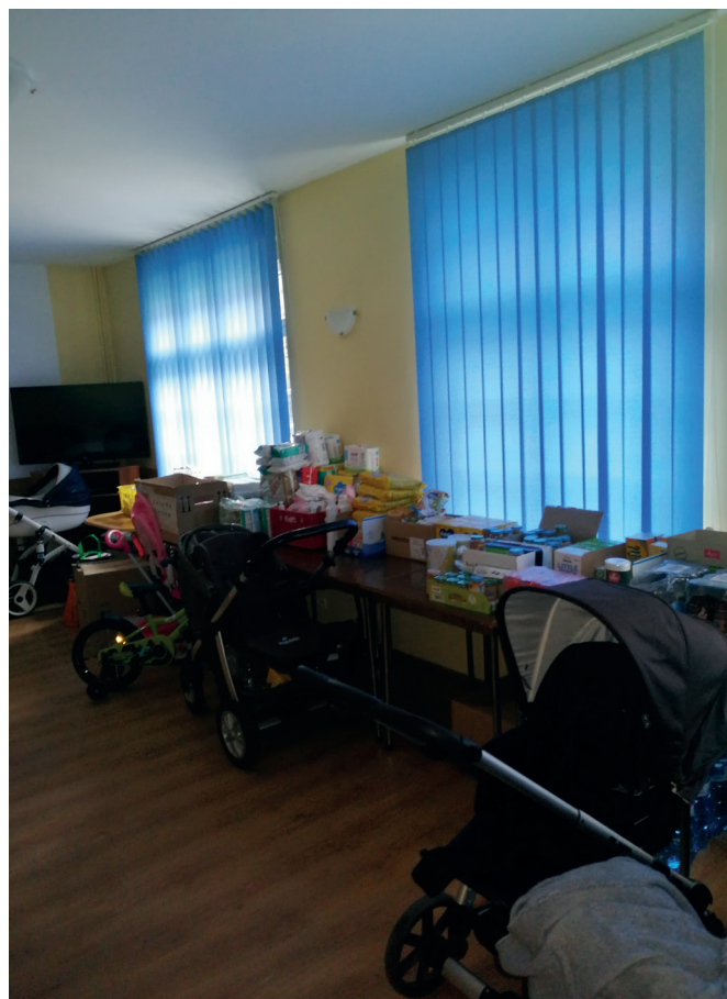
Zaplecze magazynowe w Schronisku Wycieczkowym