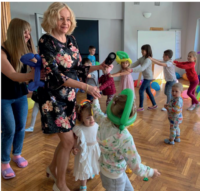
Dzień dziecka w Zespole Szkół Mechanicznych w Świdnicy dla dzieci z Ukrainy