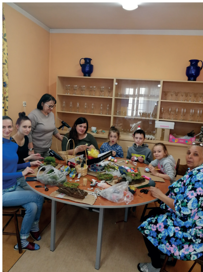
Warsztaty florystyczne przed świętami