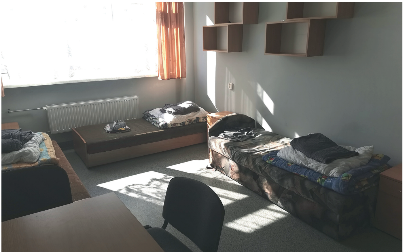
Sypialnie w internacie Zespołu Szkół Mechanicznych w Świdnicy