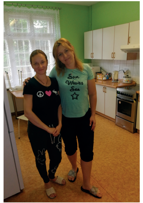
Kuchnia w Schronisku Wycieczkowym w Świdnicy