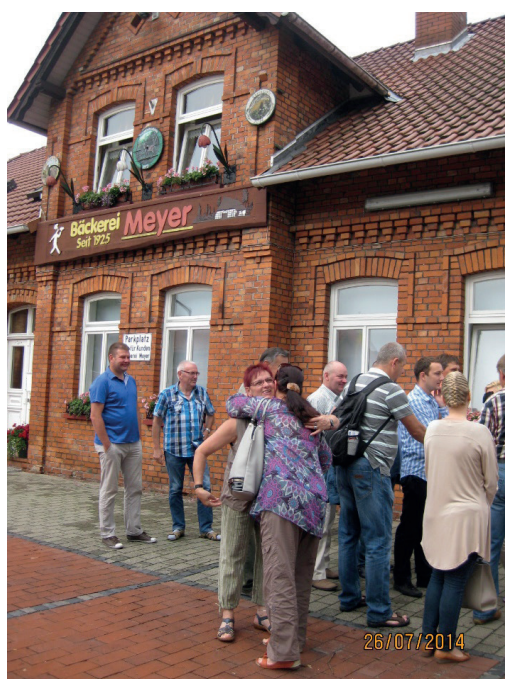
Wizyta w Wahrenholz