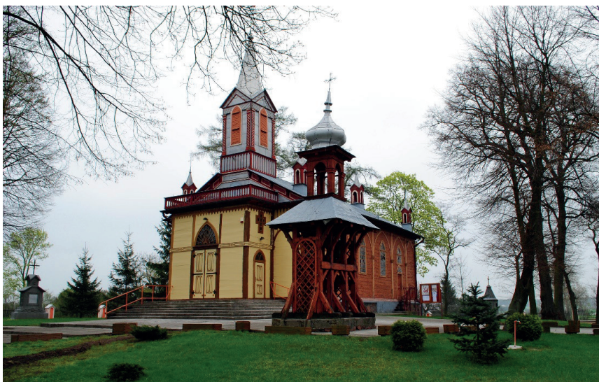
Drewniany kościół parafii pod wezwaniem NMP z 1863 r.