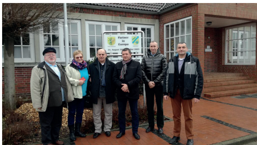
Walne Zebranie Partnerstwa Wahrenholz Sekcji Polskiej luty 2017