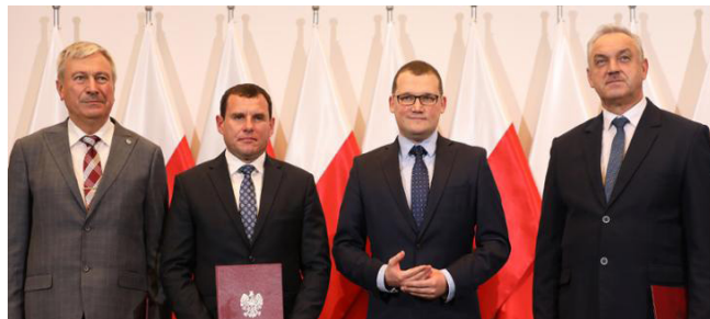
Wręczenie aktów nadania statusu miast dla Lututowa, Piątku i Klimontowa przez Pawła Szefernakera, sekretarza stanu w Ministerstwie Spraw Wewnętrznych i Administracji – 30 grudnia 2019 r., siedziba MSWiA