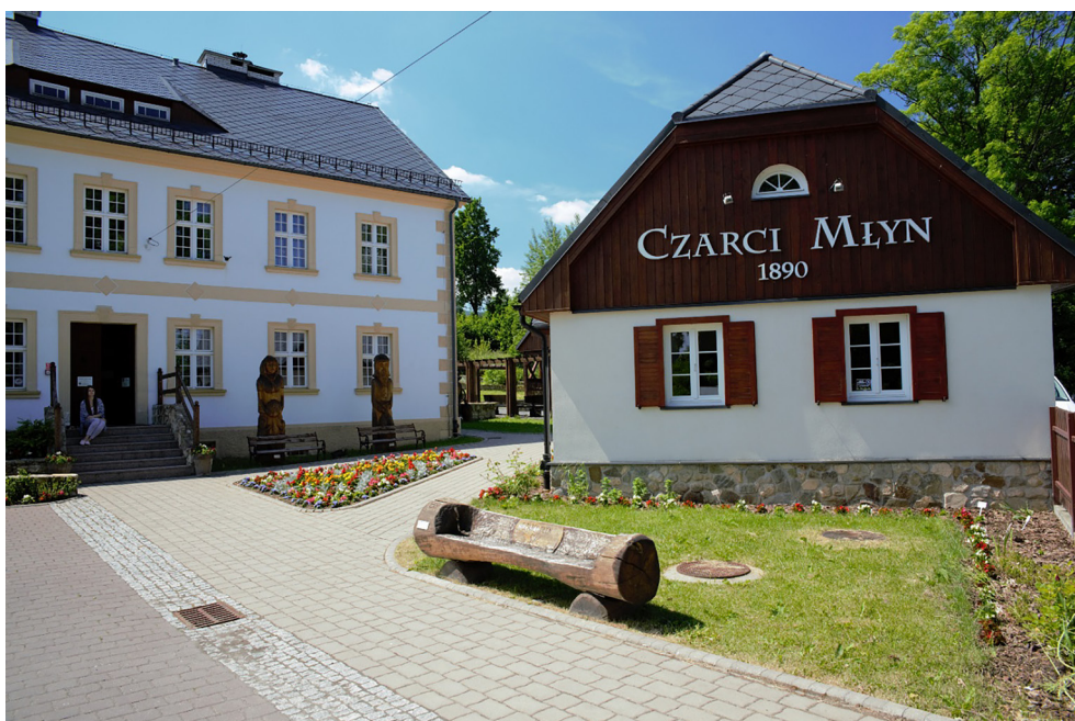
Czarci Młyn – zabytkowy młyn wodny w Świeradowie-Zdroju, osiedle Czerniawa