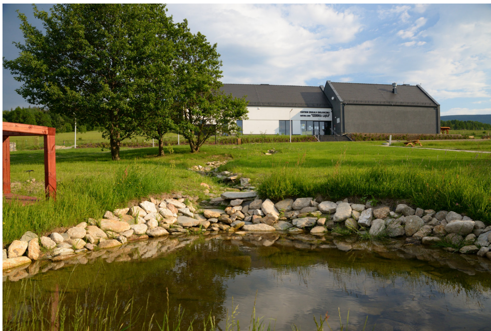
Budynek Centrum Edukacji Ekologicznej – Izerska Łąka