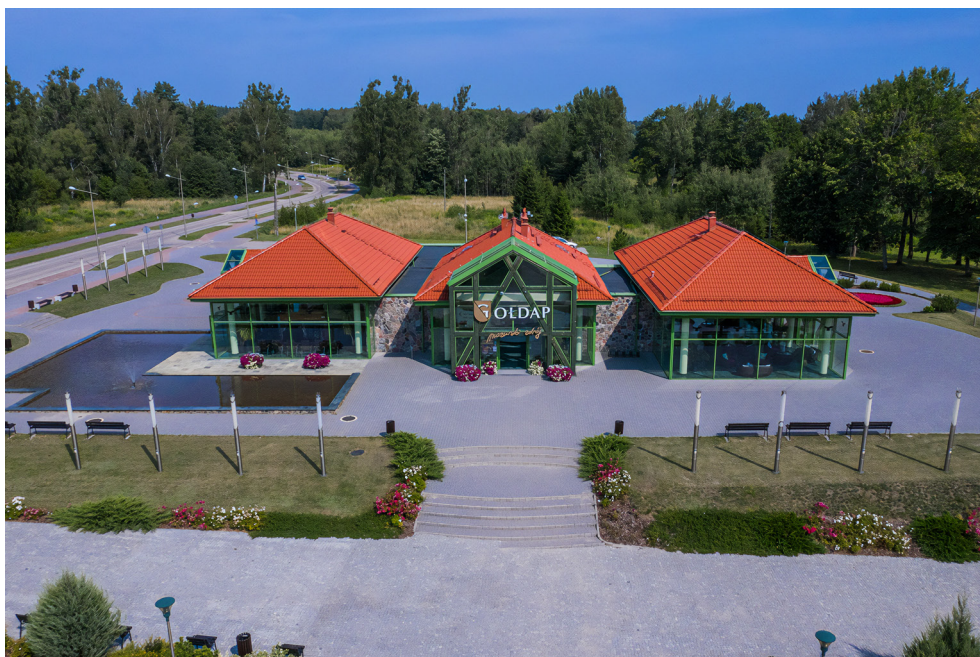
Pijalnia Wód Mineralnych i Lecznicych w Gołdapi