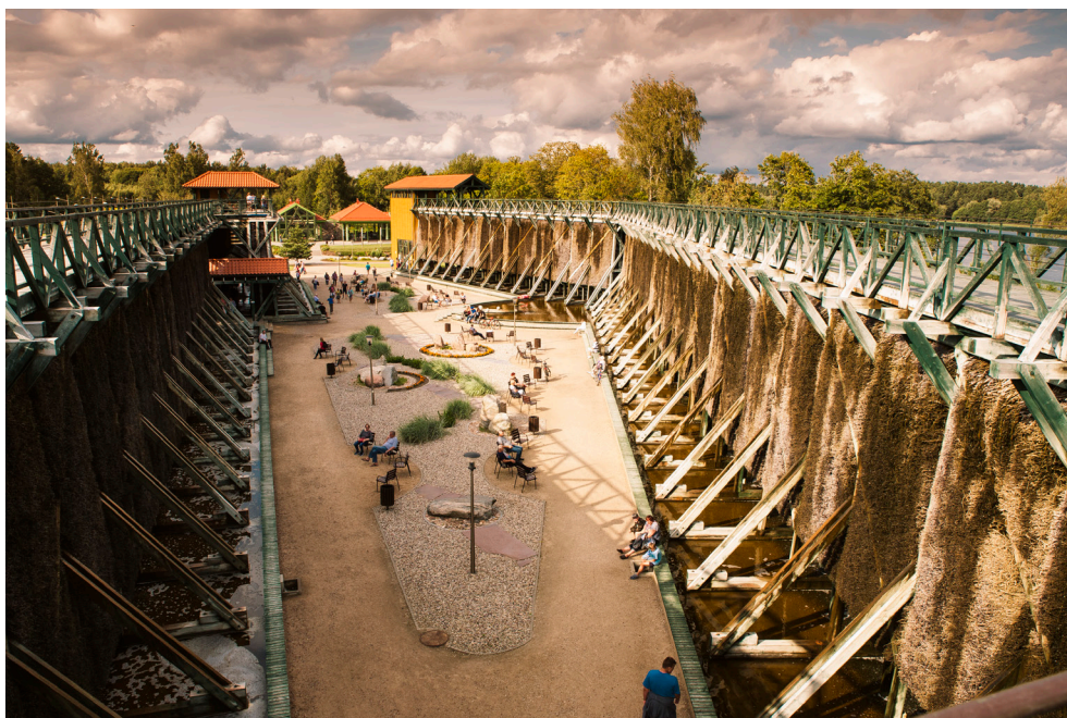
Tężnie solankowe w Gołdapi