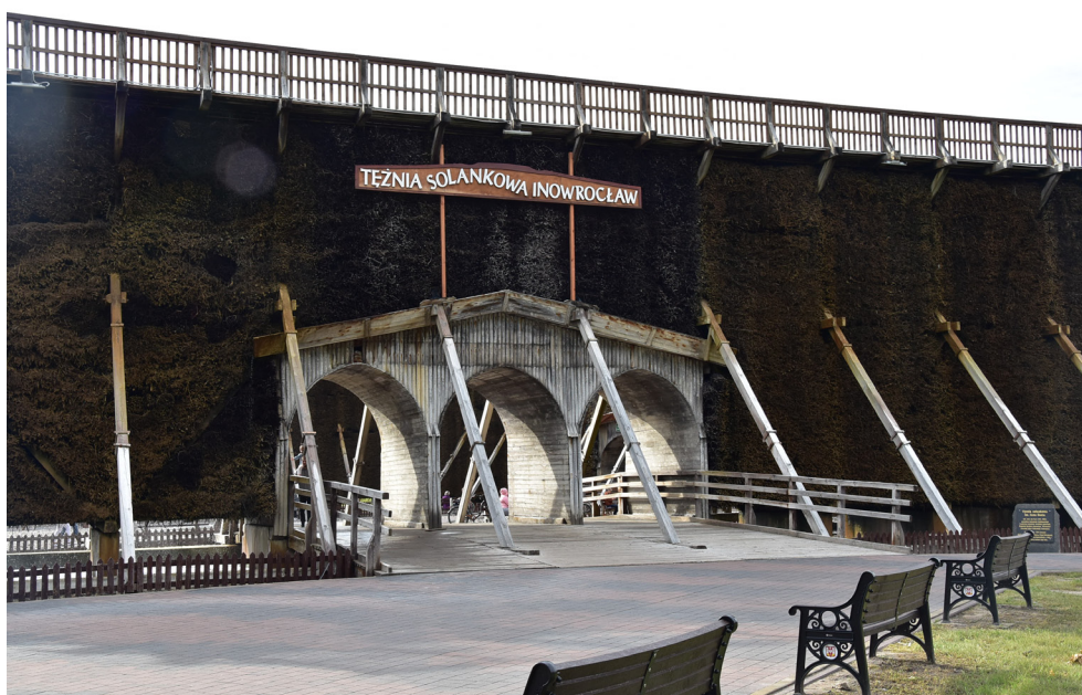
Tężnia solankowa w Inowrocławiu