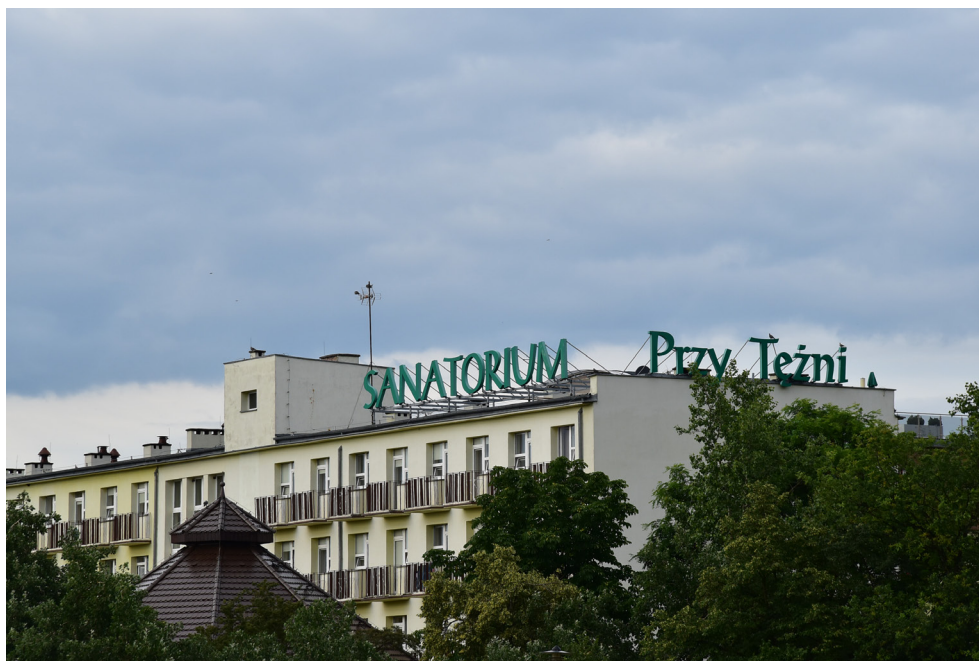
Sanatorium Uzdrawiskowe – Przy Tężni – Inowrocław