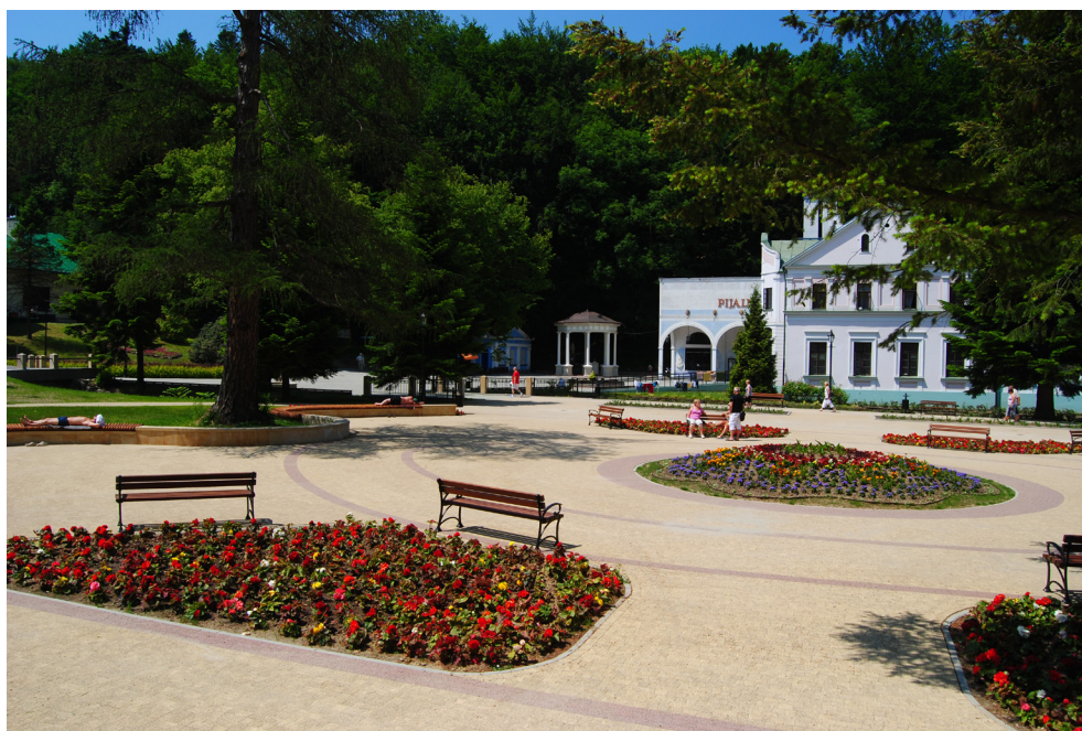
Plac Dietla w Iwoniczu-Zdroju