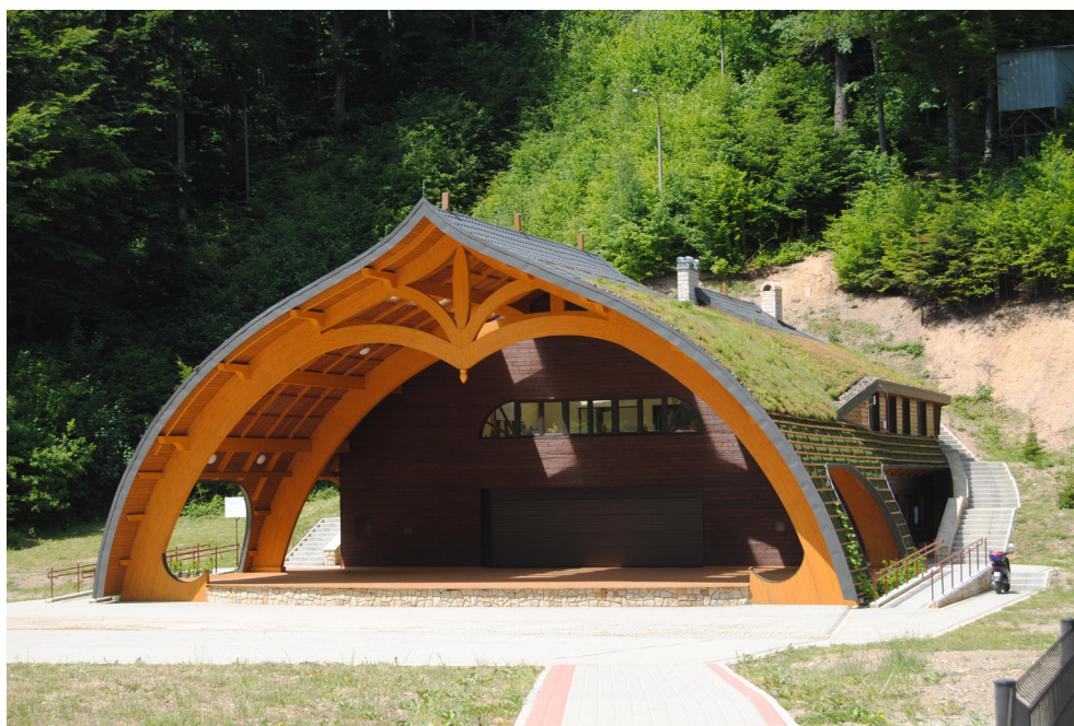
Amfiteatr w Iwoniczu-Zdroju