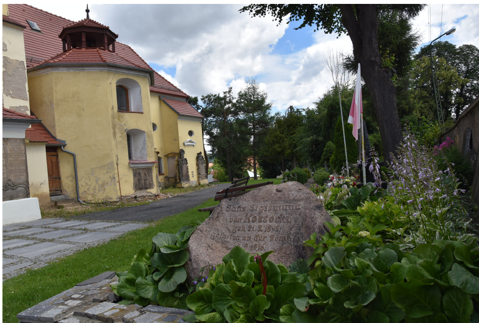
Kościół parafialny w Przerzeczynie-Zdroju