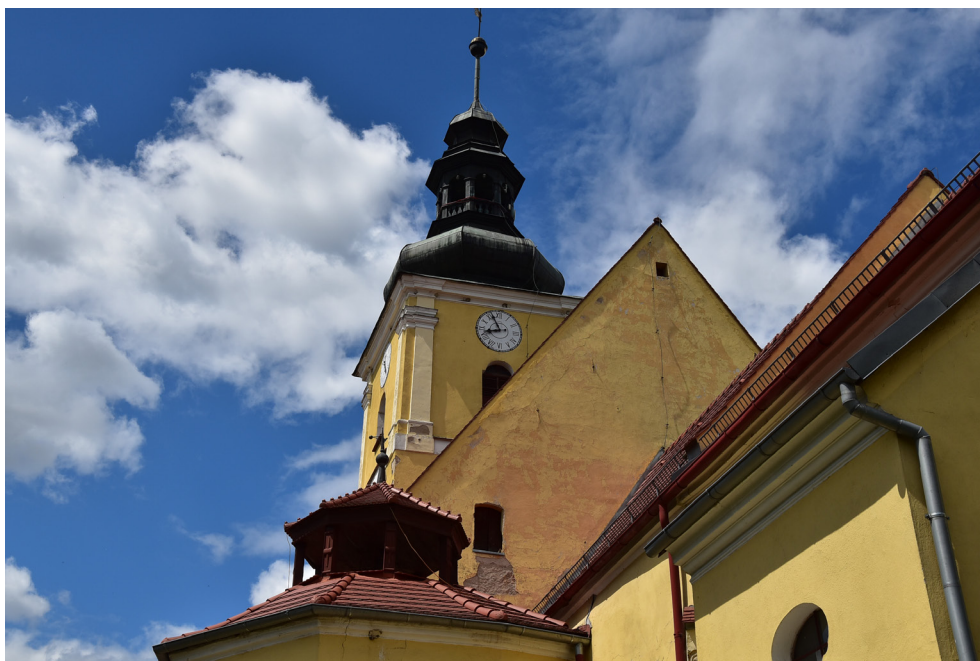
Kościół parafialny w Przerzeczynie-Zdroju