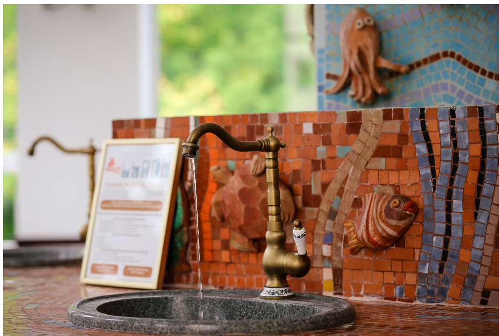
Pijalnia Wód Mineralnych – Wieniec-Zdrój