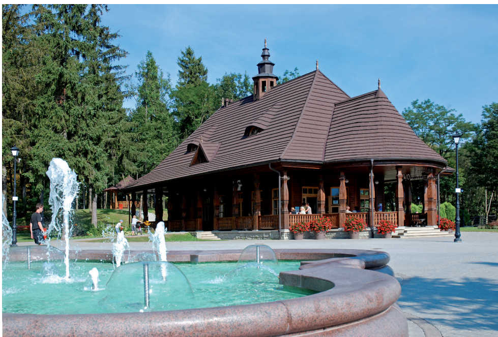
Pijalnia Wód Mineralnych w Wysowej-Zdroju