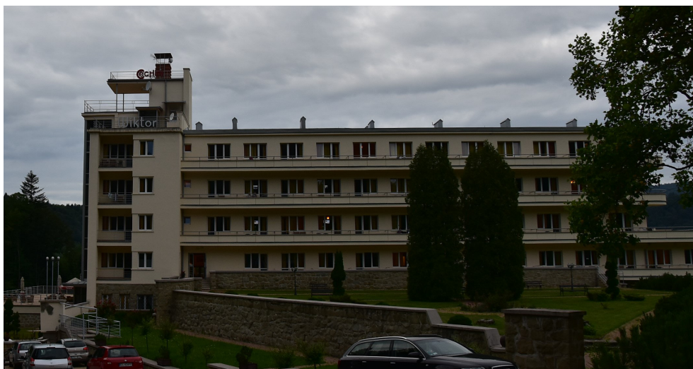
Sanatorium Uzdrowskowe Wiktor Cechini Medical & SPA