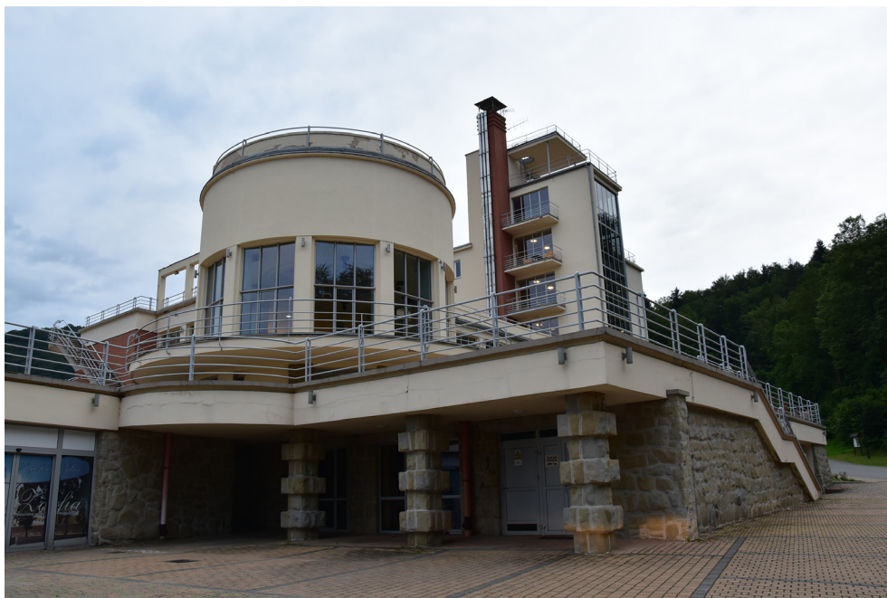
Sanatorium Uzdrowskowe Wiktor Cechini Medical & SPA – Żegiestów-Zdrój