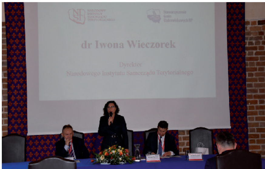
Konferencja: „Znaczenie funkcji uzdrowiskowej dla rozwoju lokalnego” - 28-29 września 2021 roku, Uniejów

W pierwszym dniu konferencji omówiono tematykę wsparcia rozwoju lecznictwa uzdrowiskowego oraz opłaty uzdrowiskowej. przewidziano również panel dyskusyjny dotyczący szans i zagrożeń dla rozwoju zakładów lecznictwa uzdrowiskowego. Drugi dzień konferencji rozpoczęła prelekcja dotycząca wyników badania pt. „Diagnoza gmin uzdrowiskowych w Polsce”. Omówiono także dobre praktyki w zakresie współpracy międzynarodowej polskich uzdrowisk. Konferencję zakończył panel dyskusyjny.