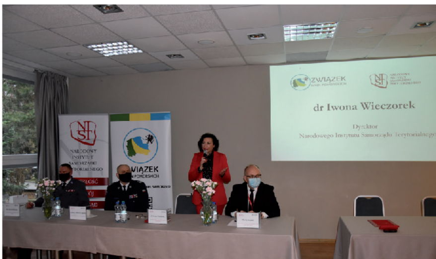
Konferencje: „Zadania i kompetencje wójta, burmistrza, prezydenta, starosty w zakresie zapewnienia bezpieczeństwa” - 25-26 listopada 2021 roku, Gdańsk

Podczas pierwszego dnia konferencji omówiono między innymi wyzwania dla samorządów w zakresie zapewnienia bezpieczeństwa młodzieży i seniorów, zapewnienia bezpieczeństwa publicznego oraz informacyjnego jako elementu działalności jst. Drugi dzień konferencji poświęcony został omówieniu możliwości i obszarów współpracy pomiędzy NIST a jednostkami samorządu terytorialnego zrzeszonymi w Związku Gmin Pomorskich.