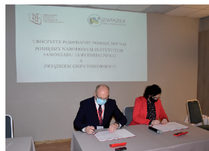
Podpisanie porozumienia o współpracy pomiędzy Narodowym Instytutem Samorządu Terytorialnego a Związkiem Gmin Pomorskich