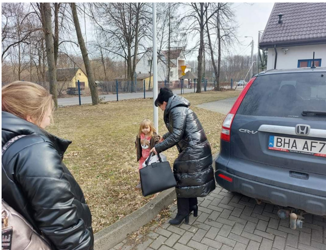
Przyjęcie obywatelki z Ukrainy z dwójką dzieci do budynku przygotowanego pod zakwaterowanie