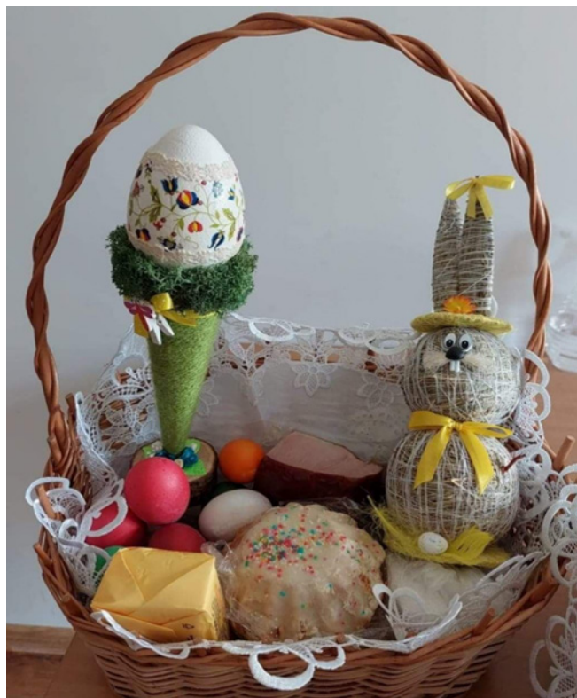
Koszyczek Wielkanocny przygotowany do poświęcenia w wielką sobotę przez obywateli Ukrainy