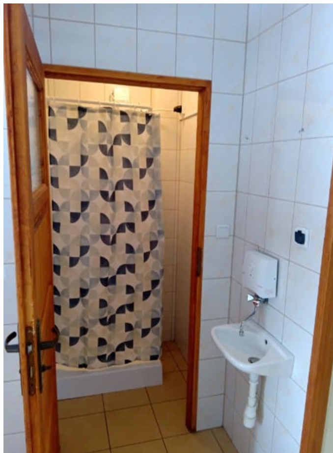
Łazienka w świetlicy, która została przebudowana, na potrzeby przyjęcia obywateli Ukrainy. Zamontowano kabinę prysznicową.