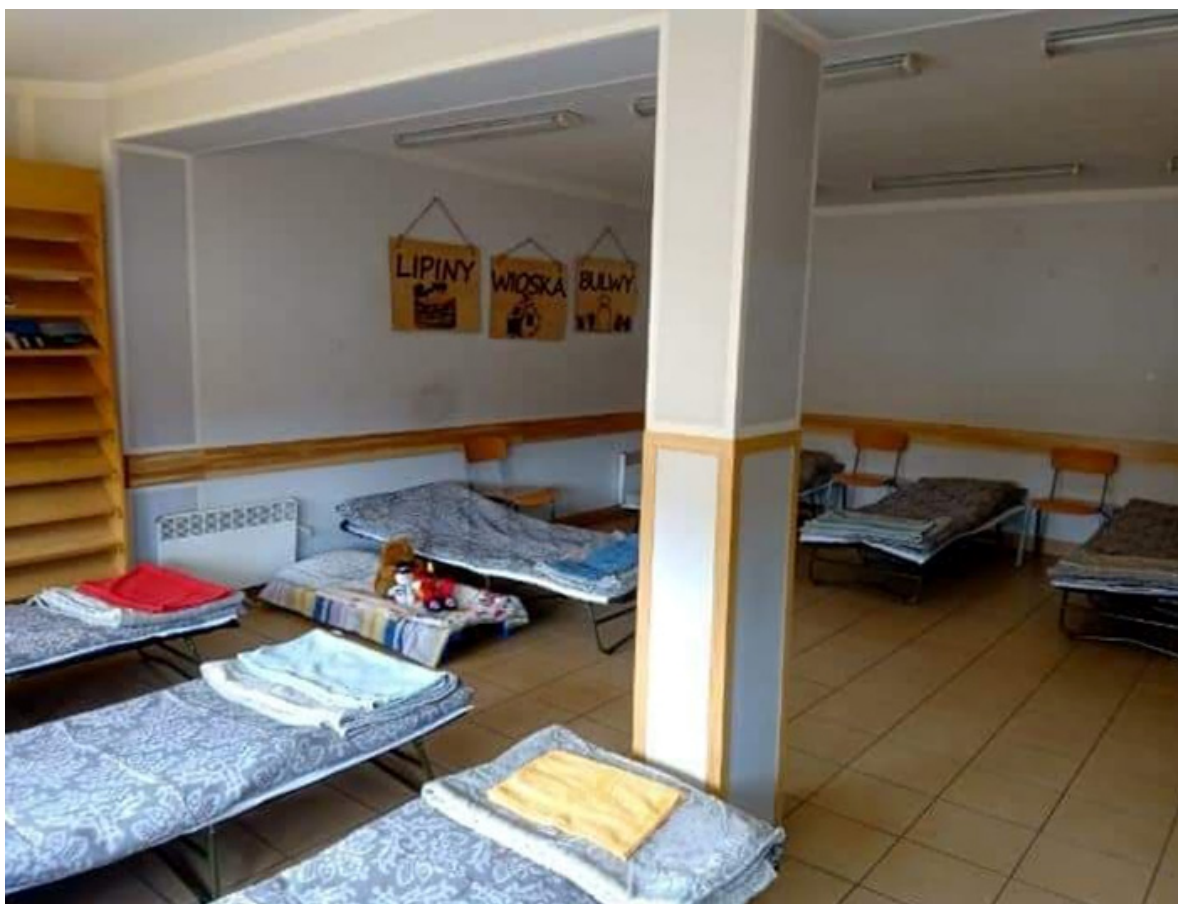
Przystosowanie i dostosowanie świetlicy w Lipinach do zakwaterowania obywateli Ukrainy. Zakup brakującej pościeli, ręczników, koców, prześcieradeł. Remont łazienki