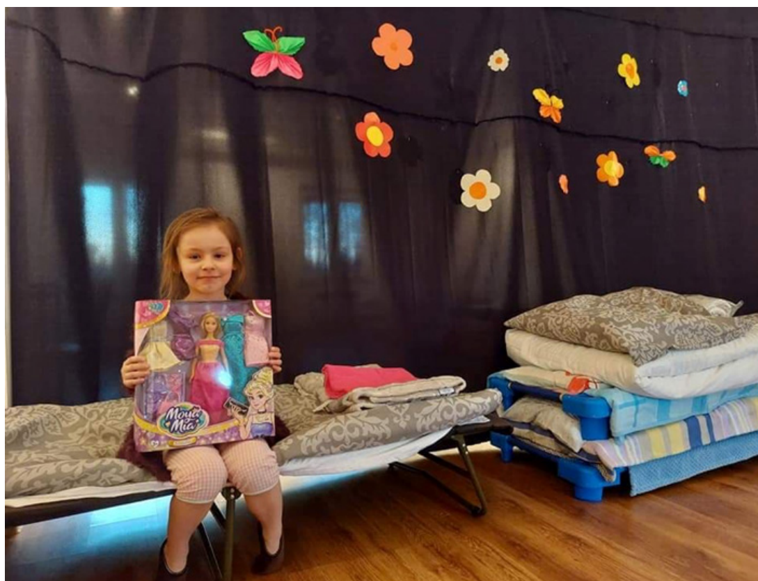
Zapewnienie prywatności poprzez przedzielenie dużej sali kotarami