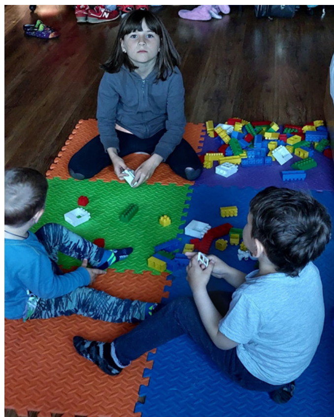
Przygotowanie kącia zabaw dla dzieci ukraińskich