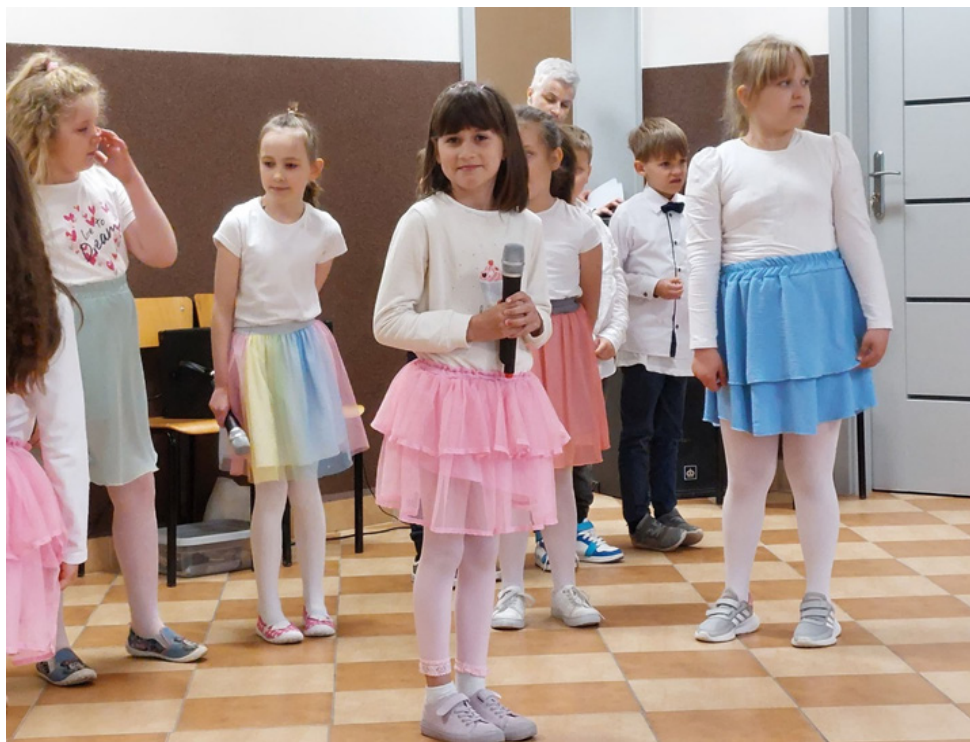
Zorganizowano wyjazd klasy z dziećmi ukraińskimi na występ do Domu Dziennego Pobytu w Nowoberezowie z okazji Dnia Matki