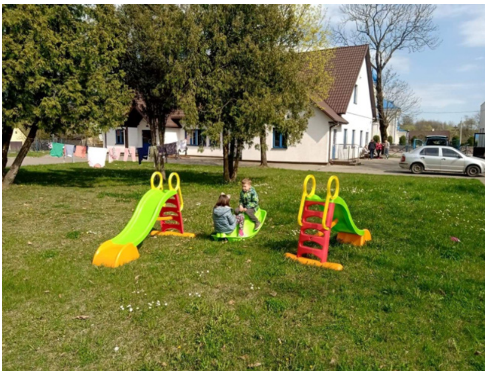
Przygotowanie miejsca zabaw dla dzieci na świeżym powietrzu przy budynku Centrum Etnograficzno-Ekumenicznym, w którym mieszkają