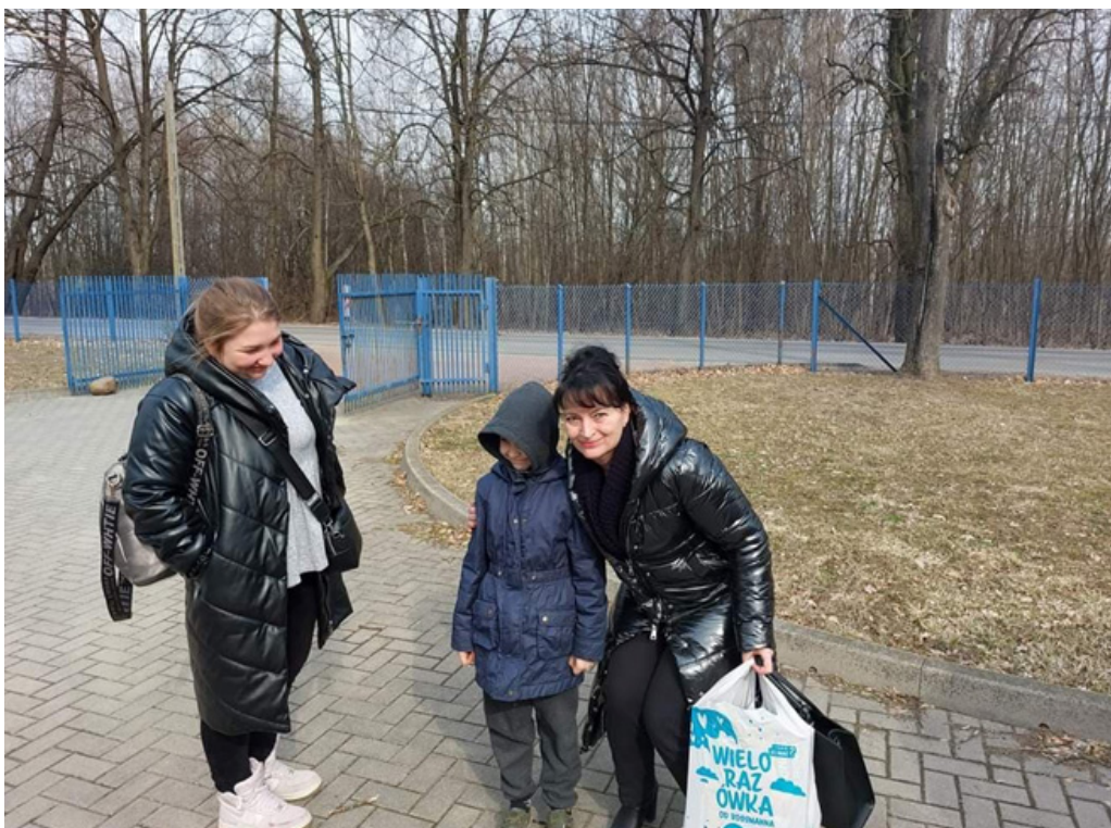
Przyjęcie obywatelki z Ukrainy z dwójką dzieci do budynku przygotowanego pod zakwaterowanie