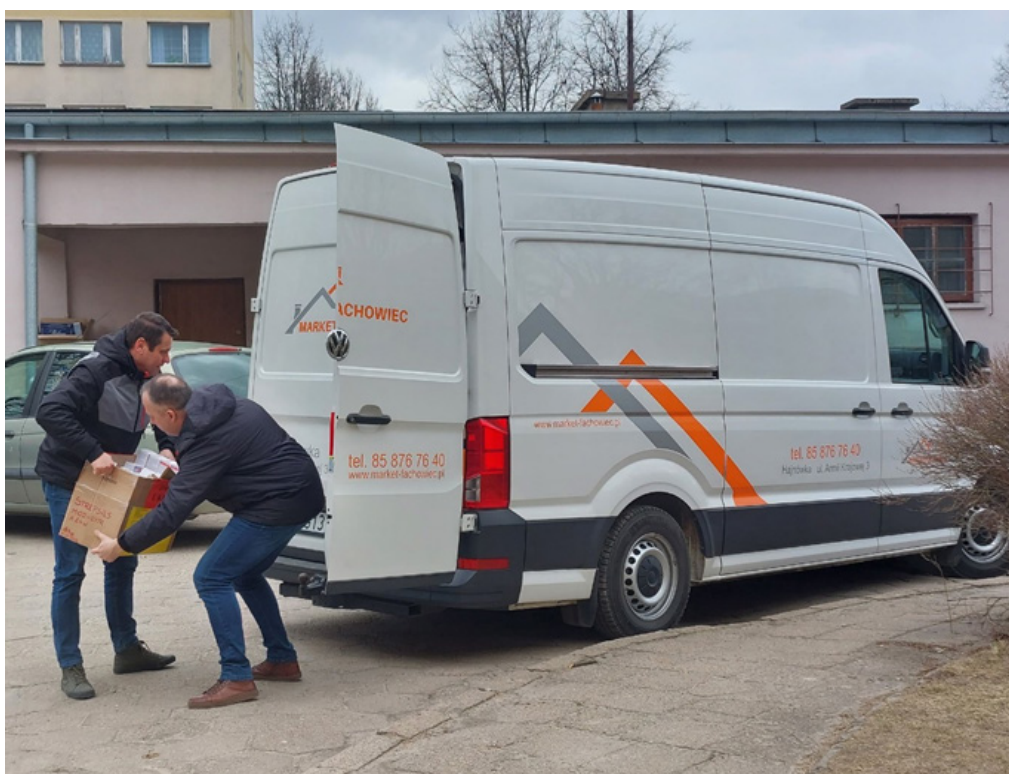
Przekazanie środków medycznych dla wojska ukraińskiego zebranych z darowizn mieszkańców Gminy i Miasta Hajnówka