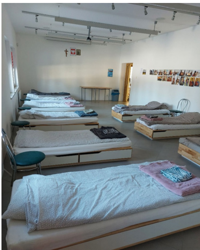
Kolejne przygotowanie budynku gminnego do zakwaterowania obywateli Ukrainy. Sprzątanie po obywatelach, którzy wyjechali