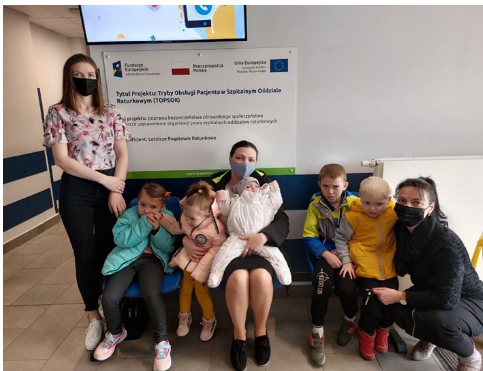
Transport do placówek medycznych związanych z chorobą dzieci ukraińskich