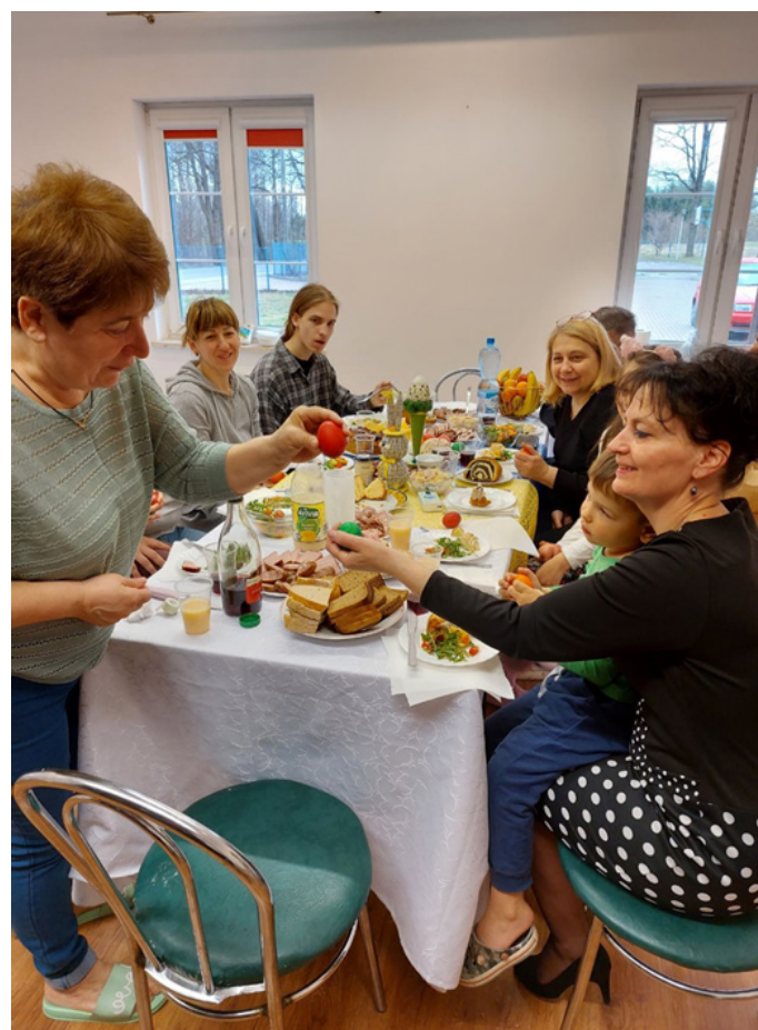
Przygotowanie śniadania Wielkanocnego dla rodzin z Ukrainy