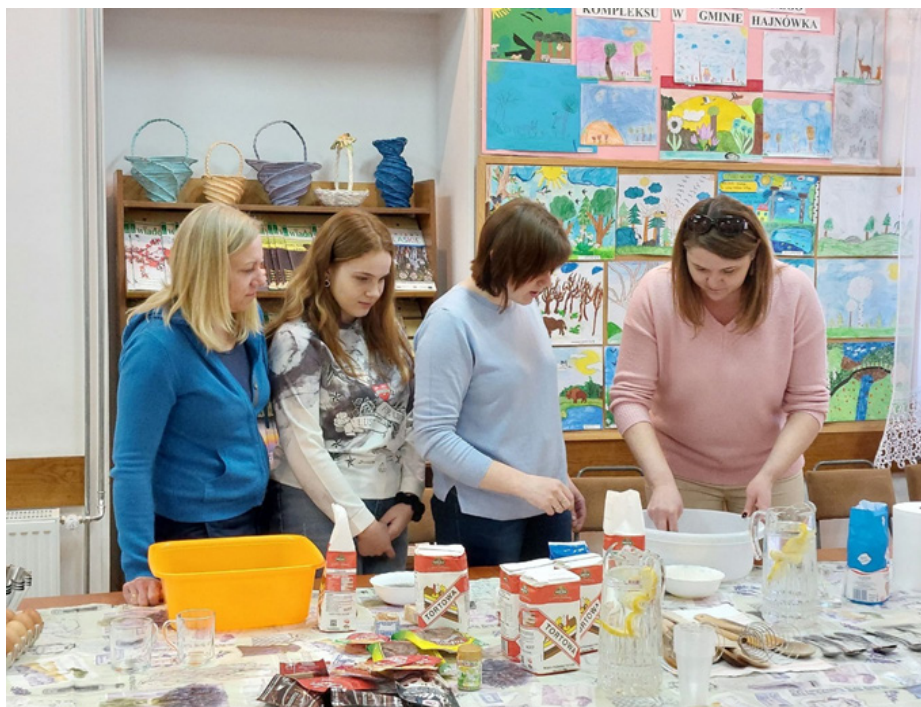
Zorganizowano warsztaty kulinarne dla obywateli Ukrainy nawiązujące do świąt Wielkanocnych