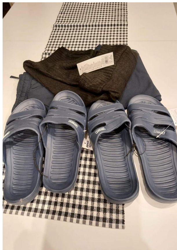
Łazienka w świetlicy, która została przebudowana, na potrzeby przyjęcia obywateli Ukrainy. Zamontowano kabinę prysznicową