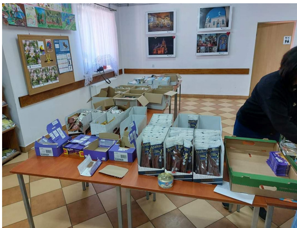
Współpraca z Bankiem Żywności Suwałki-Białystok. Żywność została przekazana dla obywateli Ukrainy zamieszkających na terenie Gminy Hajnówka