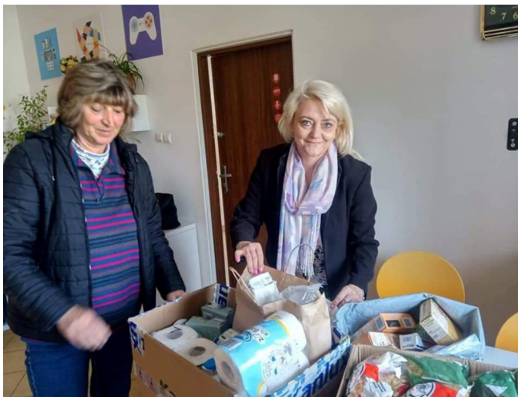
Przekazanie produktów żywnościowych i środków czystości przez Zespół Szkół Zawodowych w Hajnówce