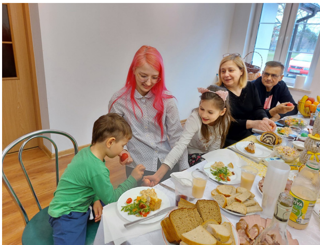
Przygotowanie śniadania Wielkanocnego dla rodzin z Ukrainy