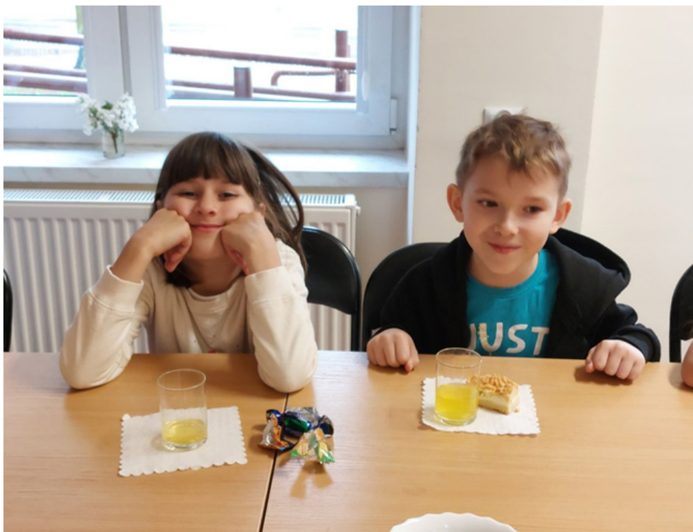
Zorganizowano wyjazd klasy z dziećmi ukraińskimi na występ do Domu Dziennego Pobytu w Nowoberezowie z okazji Dnia Matki