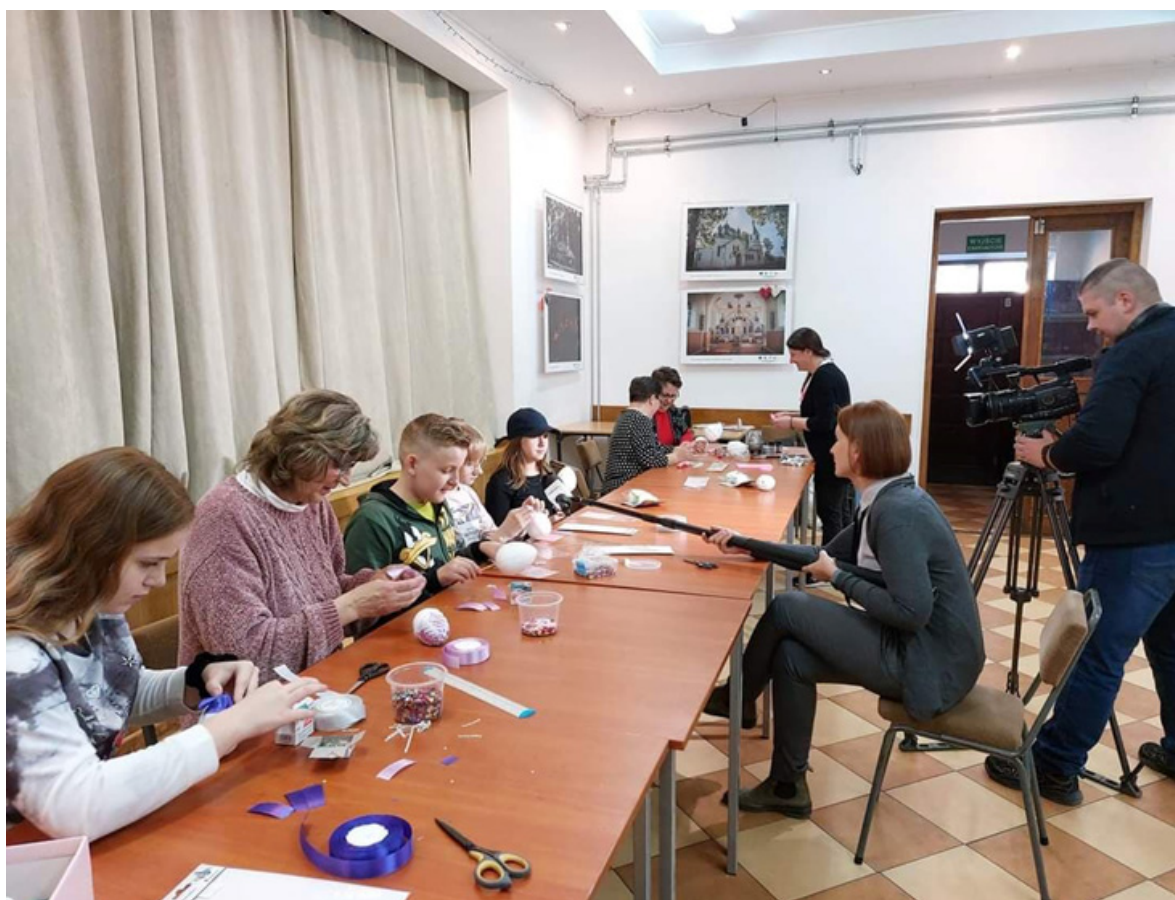
Zorganizowano czas wolny dla obywateli Ukrainy. Zaproszona została telewizja regionalna do nagrania programu o tradycjach wielkanocnych