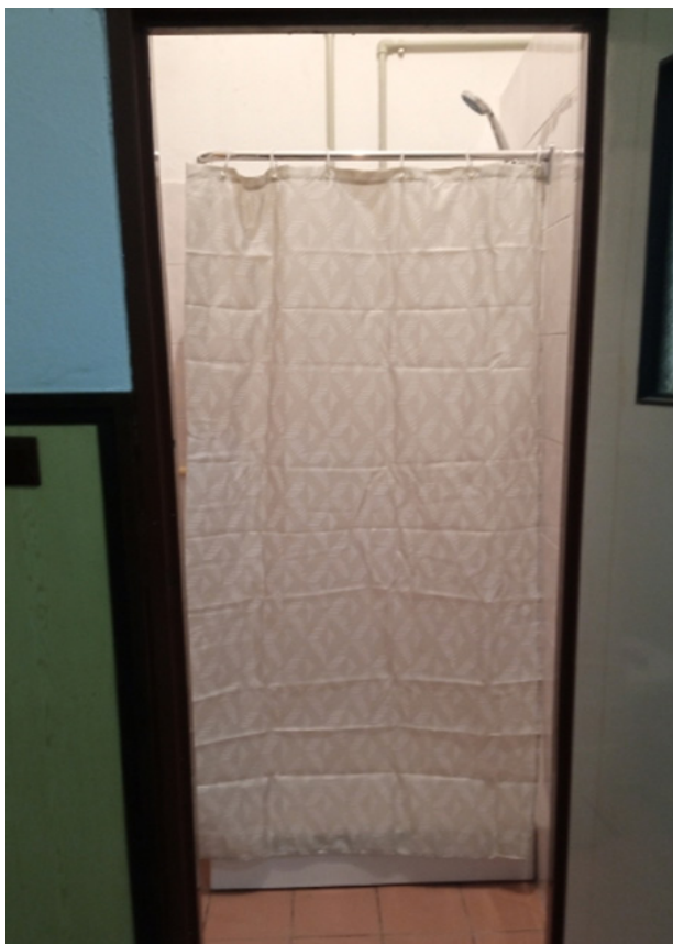
Łazienka w świetlicy, która została przebudowana, na potrzeby przyjęcia obywateli Ukrainy. Zamontowano kabinę prysznicową