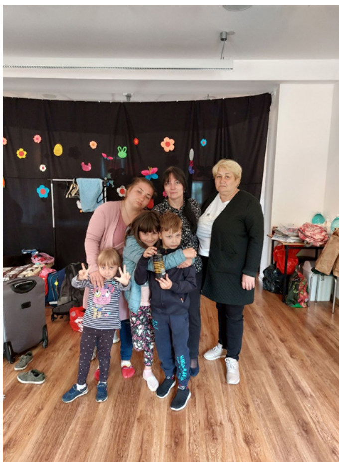
Zakupiono walizki dla rodziny wyjeżdżającej