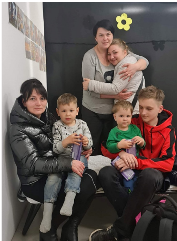
Rodzina z Ukrainy przyjęta w nocy do Centrum Etnograficzno-Ekumenicznego przyjęta osobiście przez Panią Wójt.