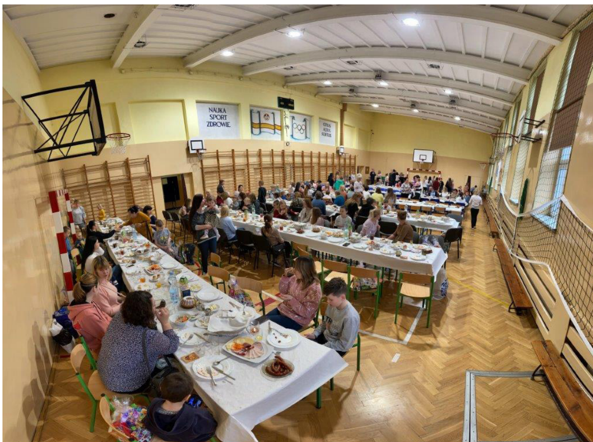
Spotkanie świąteczne dla obywateli Ukrainy - 24.04.2022 r.