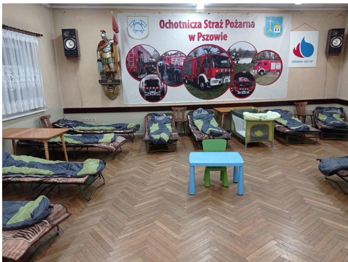
Noclegi w OSP Pszów