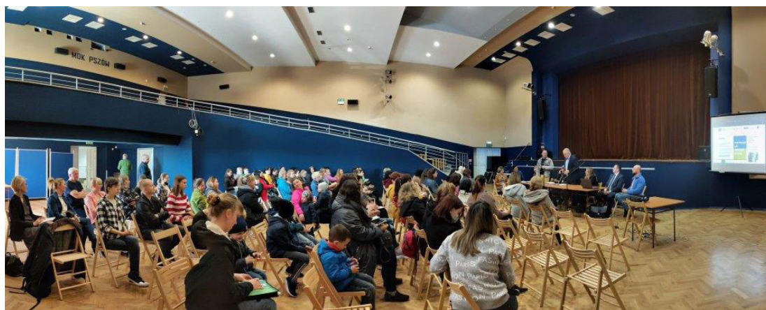
Spotkanie celem określenia pomocy z obywatelami Ukrainy

Gmina miejska Pszów jest położona na południu Polski, w województwie śląskim, w powiecie wodzisławskim. Powierzchnia gminy Pszów zajmuje obszar 20 km 2 . W 2019 roku zamieszkiwały ją 13 844 osoby. Gęstość zaludnienia na 1 km 2 wynosi 677 osób. Pszów (niem. Pschow) jest miastem usytuowanym na najwyższym wzniesieniu Płaskowyżu Rybnickiego (311 m n.p.m.), w pobliżu takich miast jak: Jastrzębie-Zdrój, Racibórz, Radlin, Rybnik, Rydułtowy, Wodzisław Śląski, Żory. W Pszowie znajdują się źródła niewielkiej strugi Suminy oraz rzeki Nacyna, będących dopływami Rudy. Pszów był siedzibą gminy Pszów do 1954 roku. W latach 1975-1998 Pszów był częścią województwa katowickiego, na początku jako dzielnica Wodzisławia Śląskiego, a od 30 grudnia 1994 roku był już samodzielnym miastem.