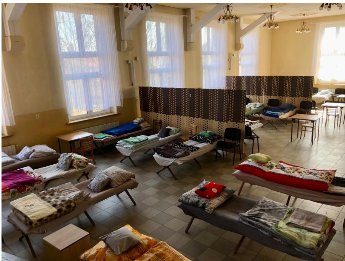
Noclegi w Domu Parafialnym