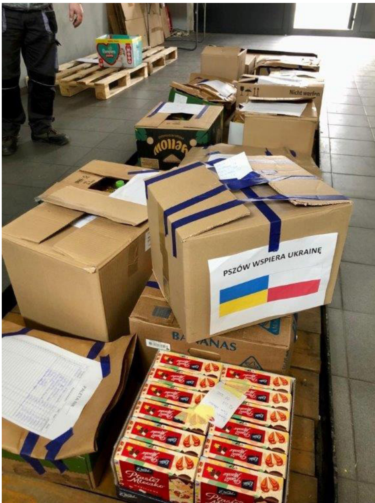
Pszów - paczki dla Ukrainy